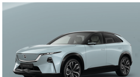
AIR STREAM BLUE - MULTI-TONE Kr. 10.000,-