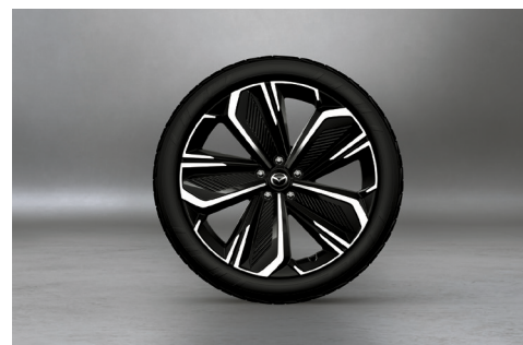
21" aluminiumsfælle, Black Diamond Cut, med dæk i dimensionen 255/40 R21