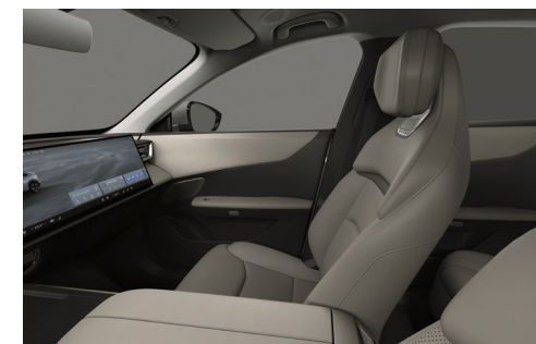
Sæder med Maztex*-kunstlæder i Warm Beige (lysegråt loft)