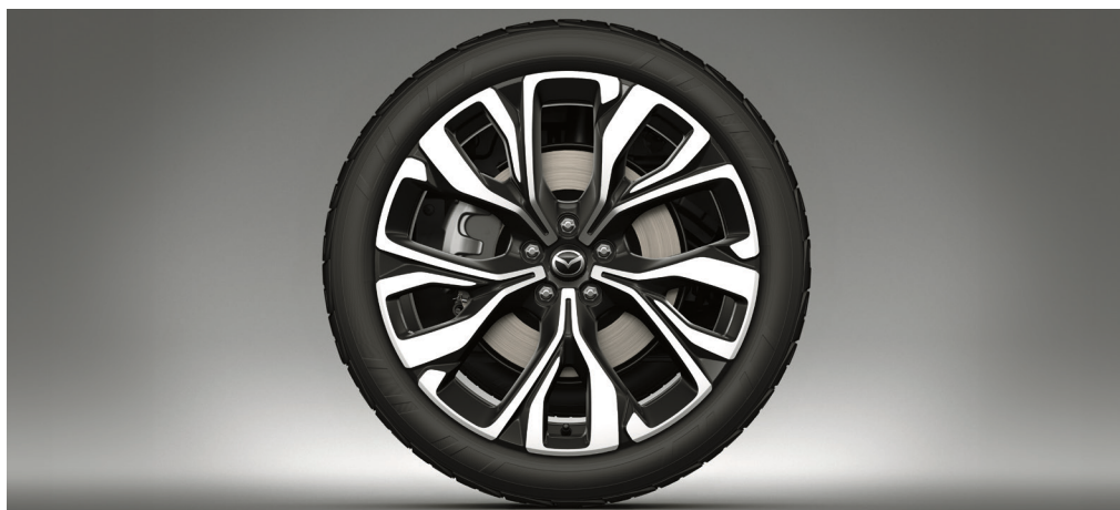
21" aluminiumsfælgje, Diamond Cut med kontrastlakering