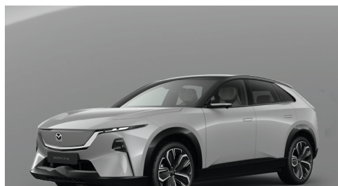
AERO GREY - MULTI-TONE Kr. 10.000,-