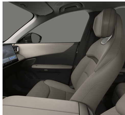
Sæder med Maztex*-kunstlæder i Warm Beige (lysegrå loft)