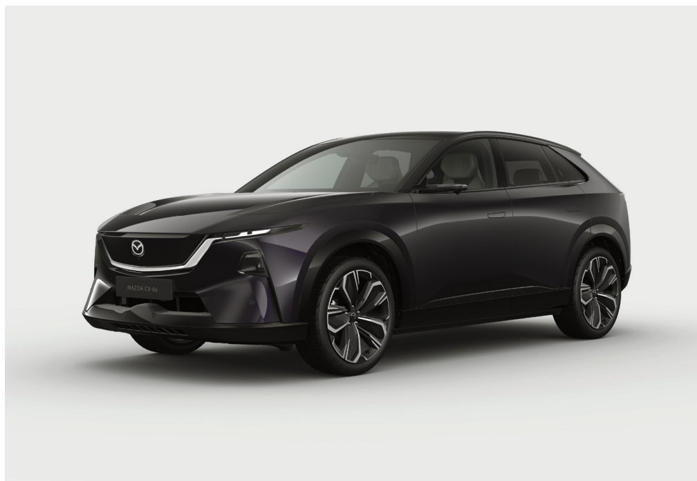
Billedet viser den nye Mazda CX-6e Takumi Plus i farven Nightfall Violet