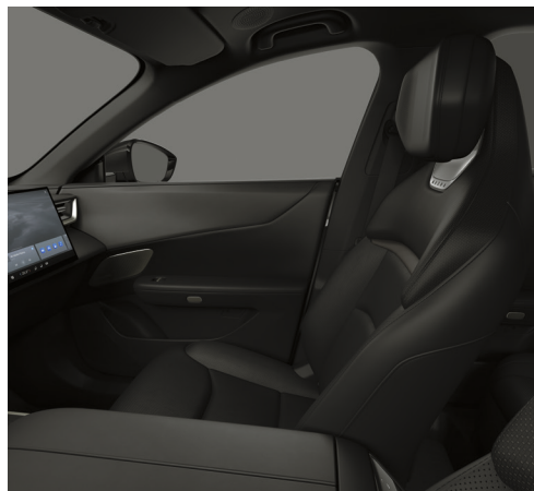
Sæder med Maztex*-kunstlæder i sort (sort loft)