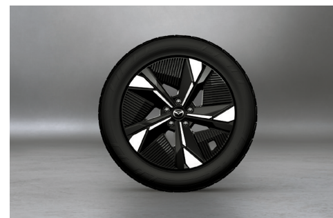
19" aluminiumsfælle, Black Diamond Cut, med dæk i dimensionen 235/55R19