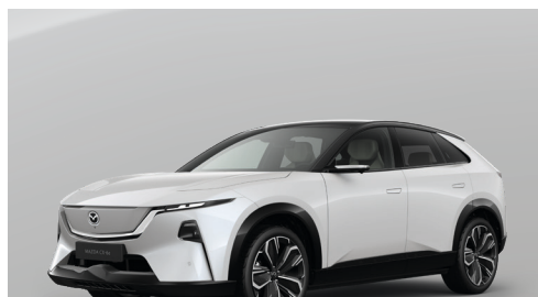
CRYSTAL WHITE PEARL - MULTI-TONE Uden merpris