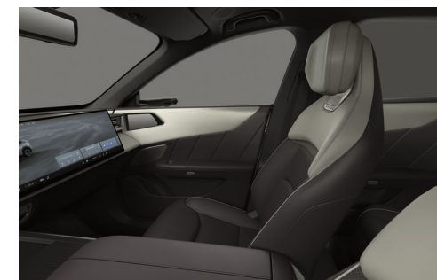
Sæder med tofarvet Maztex*-kunstlæder, Amethyst/hvid