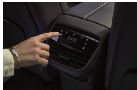
Varme og ventilation i bagsædet