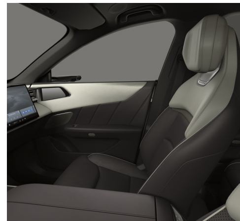
Sæder med tofarvet Maztex*-kunstlæder, Amethyst/hvid