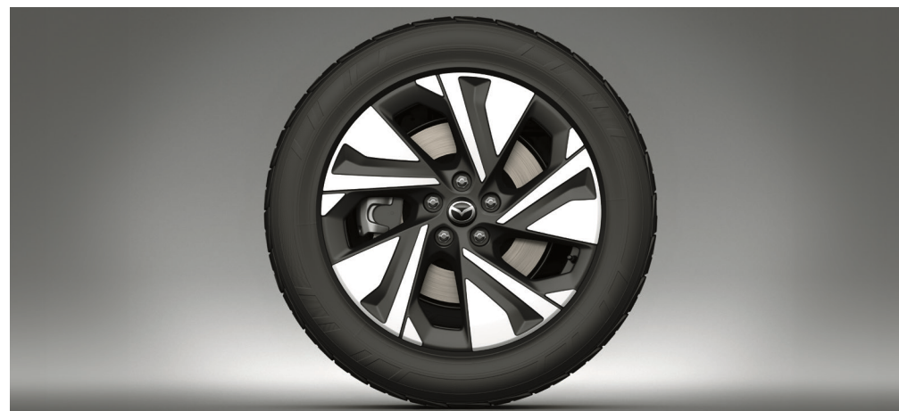
19" aluminiumsfælgje i grå Diamond Cut