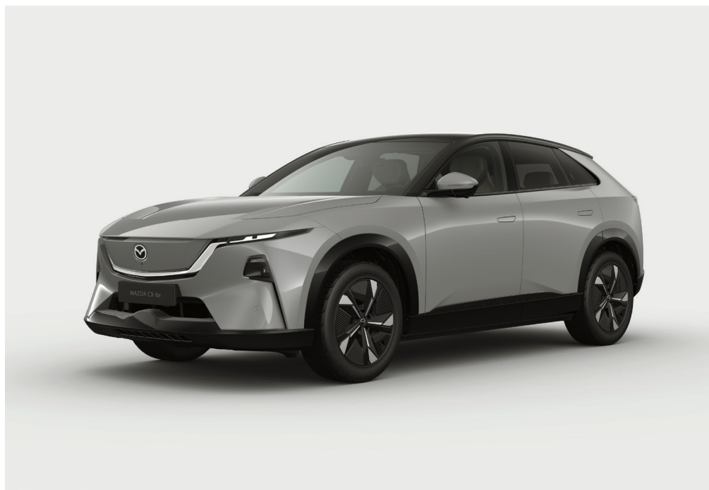
Billedet viser den nye Mazda CX-6e Takumi i farven Aero Grey