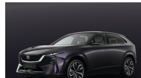
NIGHTFALL VIOLET - MULTI-TONE Kr. 11.000,-