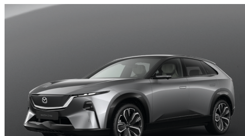
MACHINE GREY - MULTI-TONE Kr. 11.000,-