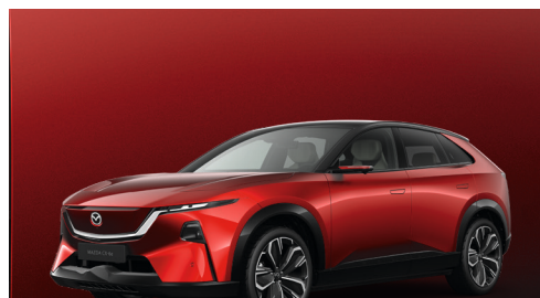
SOUL RED CRYSTAL - MULTI-TONE Kr. 12.000,-