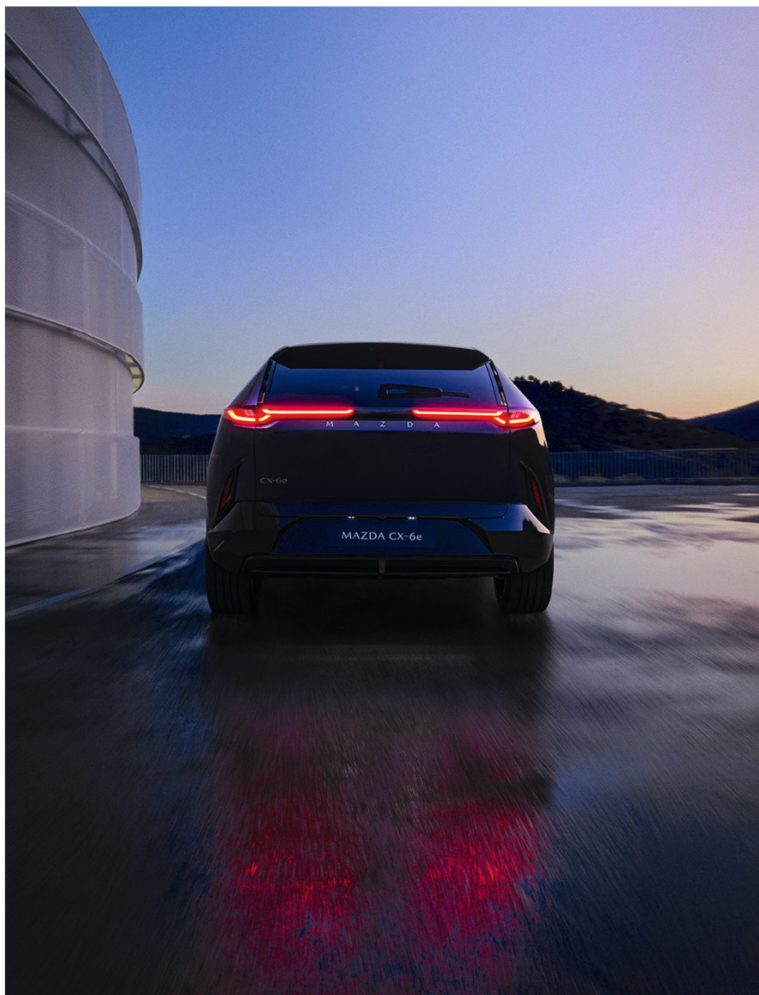
Billedet viser den nye Mazda CX-6e i farven Nightfall Violet