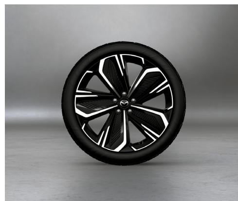
21" aluminiumsfælg, Black Diamond Cut, med dæk i dimensionen 255/40 R21

* Mazdas veganske alternativ til læder: slidstærkt, nemt at rengøre og designet til komfort