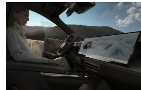
26.45" berøringfølsom farveskærm