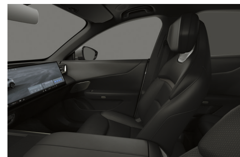
Sæder med Maztex*-kunstlæder i sort (sort loft)