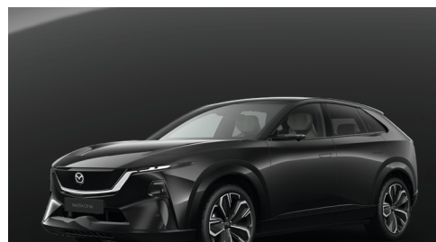
JET BLACK Kr. 10.000,-