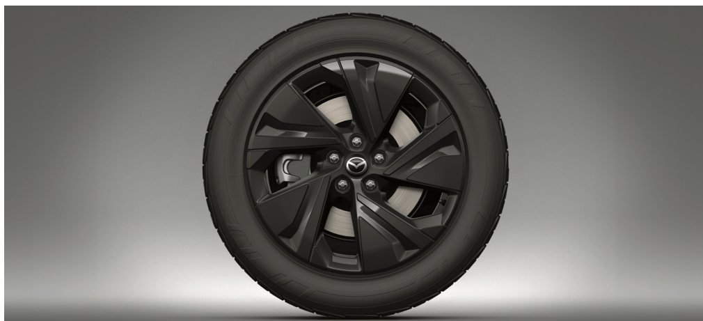
19" aluminiumsfælgje i blank sort metallic