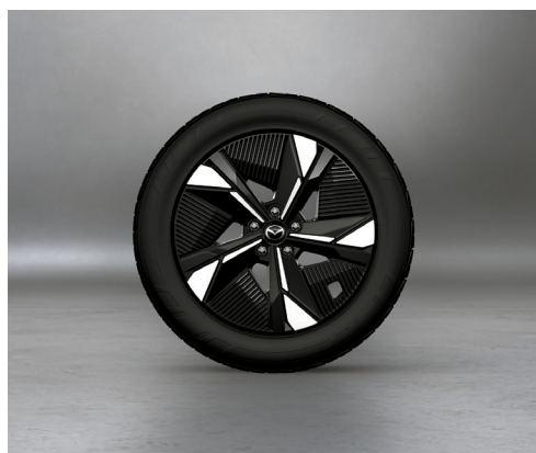
19" aluminiumsfælg, Black Diamond Cut, med dæk i dimensionen 235/55R19